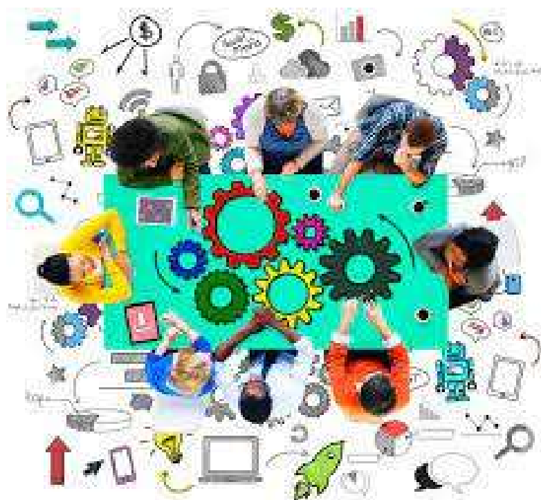
La Commissione Continuità