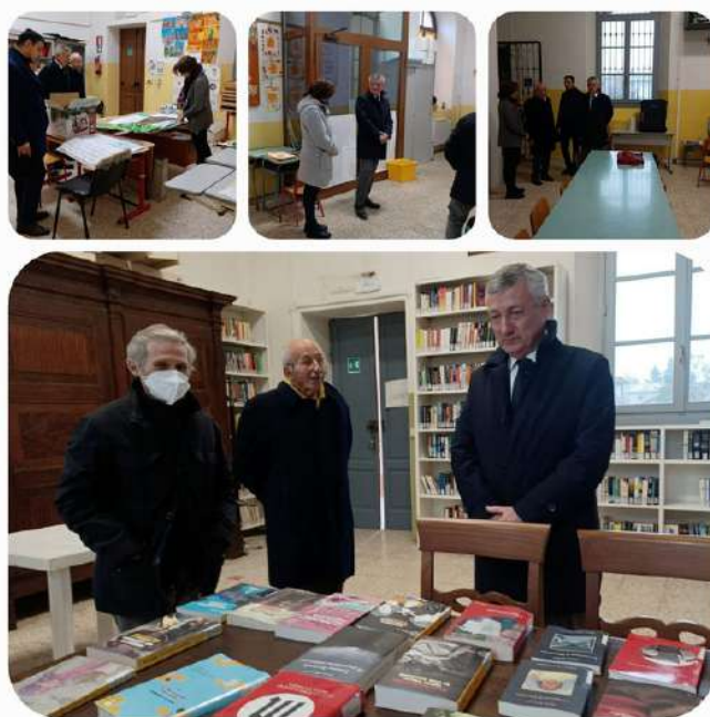
Il team della scuola primaria di Casalnoceto