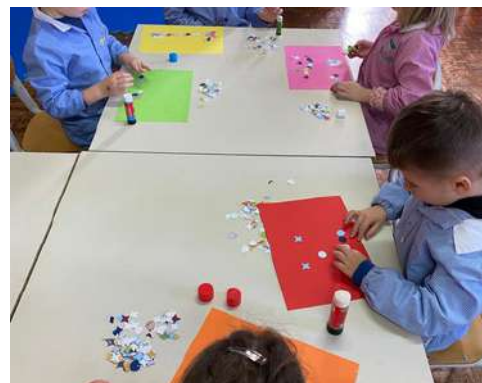
Garbagna e Gremiasco