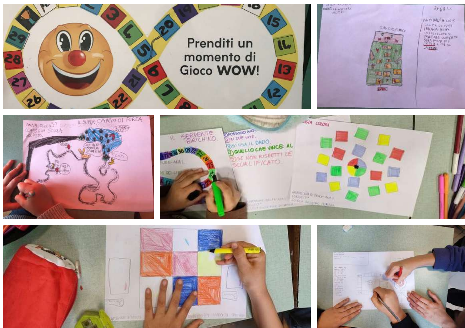
Gli alunni e le insegnanti della Scuola Primaria di Volpedo

I giochi sono stati guidati in un processo condiviso e disegnati su carta dagli alunni con molto entusiasmo.