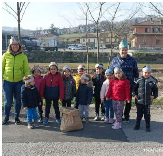
Casalnoceto San Sebastiano Volpedo