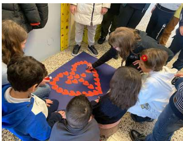
Il team della scuola primaria di Garbagna